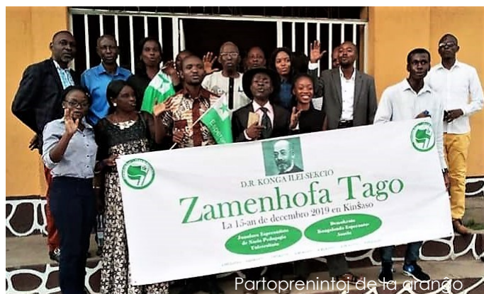
Partoprenintoj de la aranĝo