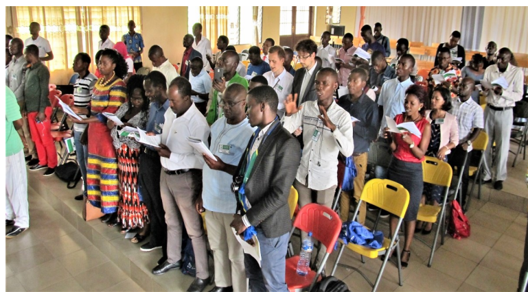
Kunkantado de la himno La Espero

legi la kongresan libron: https://www.esperanto-afriko.org/Libro%20de%20la%207-a%20AKE.pdf