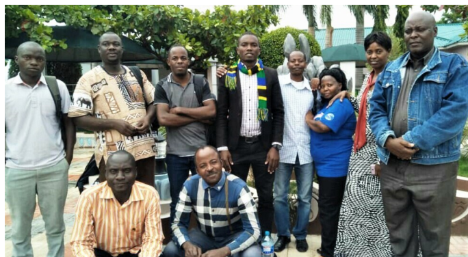
Grupa foto de la kunvenintoj

Dumkunsido okazis atenta trastudo de artikolo post artikolo, modifproponoj same pri la formo kiel pri la enhavo de la prezentita statuto. Ĉe la fino kaj sub la rezervo pri amendoj, la kunvenintoj per aplaŭdo aprobis unuanime la novan statuton de TEA.