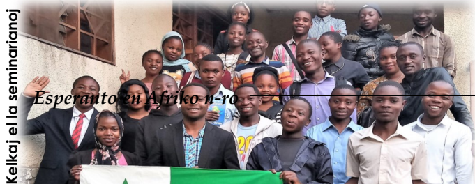
Kelkaj el la seminarianoj