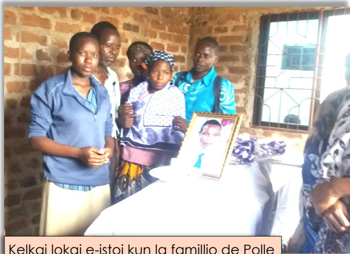
Kelkaj lokaj e-istoj kun la familio de Polle

Esperanto en Afriko estas trimonata oficiala periodaĵo de la Afrika Komisiono de UEA pri la Esperantomovado en Afriko.