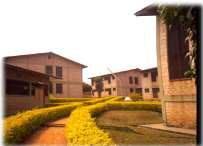
La hejmo de la 7-a Afrika Kongreso de Esperanto

Ni celas la membrojn de la nova Afrika Komisiono de UEA, por ke ili plifortigu sian kapablon gvidi la movadon en la kontinento; pro tio ni ŝatus ke ĉiuj AK-anoj ĉeestu la kongreson kaj profitu la AMO-seminaron, kiu certe maturigos ilin. Ni ankoraŭ ne kolektis sufiĉajn monrimedojn por povi partoprenigi ĉiujn membrojn de la Afrika Komisiono de UEA, kiu havas gravan taskon en la afrika E-movado. Ankoraŭ mankas pli ol 3000 eŭroj.