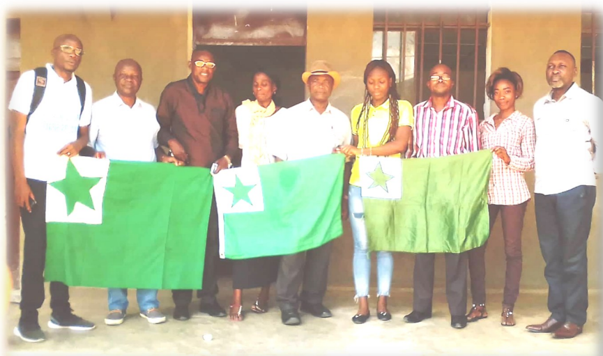
Kelkaj el la partoprenintoj de la konversacia rondo

Notindas, ke la renkontiĝo dekomence estis planita por okazi en la Nacia Pedagogia Universitato (UPN), sed pro striko tie, ĝi devis translokiĝi. Konsekvence, nur malmultaj esperantistoj povis partopreni. La posta konversacia rondo okazos venontdecembre en ligo kun la Zamenhofa Tago (ankaŭ konata sub la Tago de la Libro) en UPN, kie Esperanto-semoj jam ekzistas kaj atendas nur akvon por kreski.