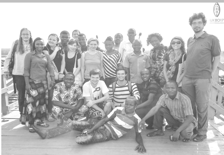
Partoprenintoj de ekskurso dum TEJO-seminario oktobre 2016 en Kotonuo

Malgraŭ tio ke la decido pri la okazigo de la IJK en Togolando estis tre malfrue anoncita, 85 personoj sur 4 kontinentoj el 24 landoj jam aliĝis al la renkontiĝo. Eble la nombro de la ĉi-jaraj IJK-anoj estos malpli ol 100 personoj, tamen oni esperas havi pli grandan eventon ol tiujn, kiuj okazis en 1962 en Ystad (Svedio) kaj en 2013 en Nazareto (Israelo), respektive, kun 70 kaj 90 aliĝintoj. Krome la 73-a IJK plej verŝajne ankoraŭ altiros pli da aliĝemaj landoj ol kelkaj el la jam okazintaj IJK.