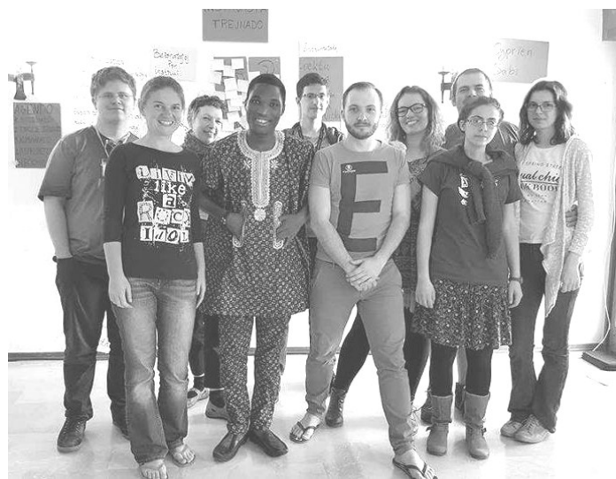
Kelkaj el la partoprenintoj de la IJF 2017 en Italio

Mi povas diri ankaŭ ke ni havis la okazon partopreni en la Internacia Junulara Festivalo (IJF), kiu estis granda kaj bela festo. Ĝi kunigis diversnacianojn, eĉ azianoj partoprenis en ĝi. Tiu festivalo estis bone organizita kaj ĉio estis en ordo dum la festo, la programo estis respektita akurate, kio agrable mirigis min kaj pro kio mi gratulas la organizantojn! La renkontiĝo estis granda okazo por mi interŝanĝi kun multaj