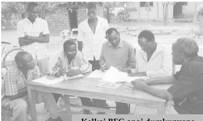
Kelkaj BEC-anoj dumkunvene

La ideo pri turisma grupo konkretiĝis. La grupo celas a) disvastigi Esperanton per turismo, b) bonvenigi esperantistajn kaj ne esperantistajn turistojn el la tuta mondo kaj konigi al ili vididindaĵojn per ĉiĉeronado en Tanzanio. La grupo funkcias sub la respondeco de Barnabas