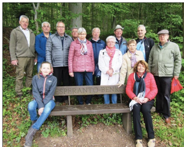
Gemeinsame kleine Einweihung durch die beiden Herzberger Vereine bei der sog. "Ersten Esperanto-Bank"

Ein neues zweisprachiges Flugblatt mit den diversen Bänke-Haltestationen für kleine Pausen können Interessierte beim Bürgerbüro der Stadt, beim Touristinfo und beim Esperanto-Centro Herzberg erhalten.