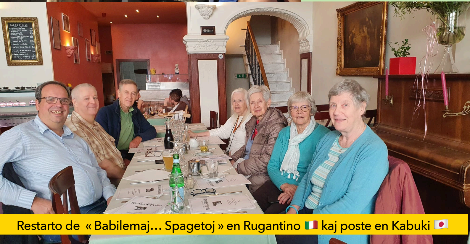
Restarto de « Babilemaj... Spagetoj » en Rugantino 🇮🇹 kaj poste en Kabuki 🇯🇵