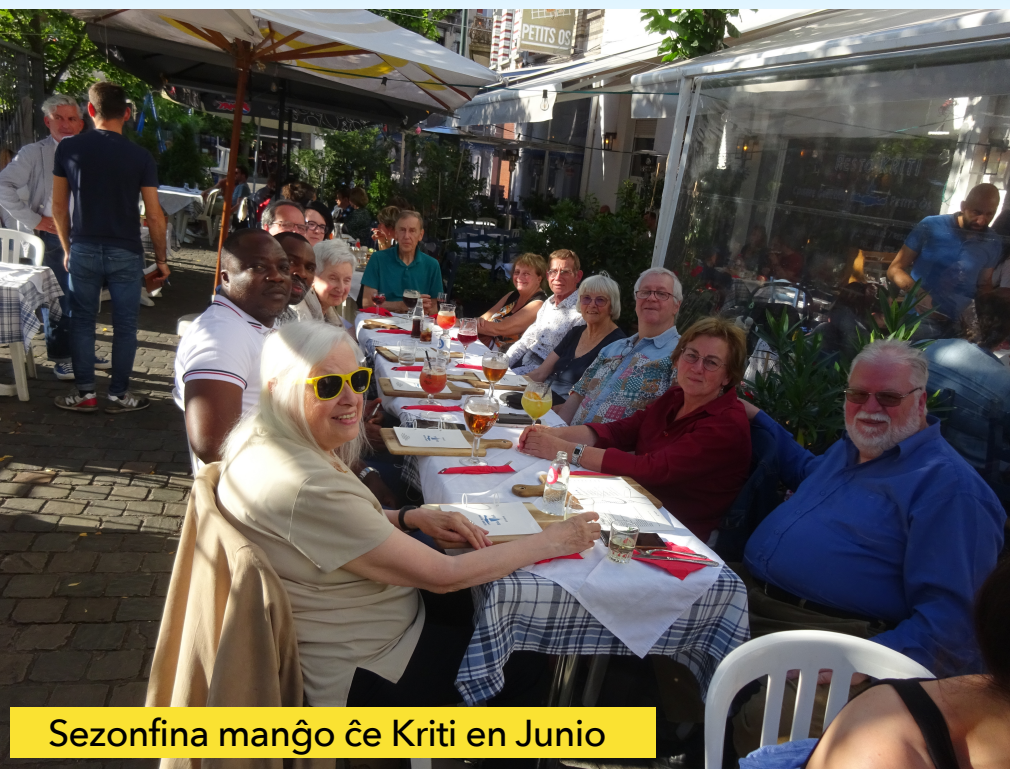
Sezonfina manĝo ĉe Kriti en Junio

Revuo de la Esperantista Brusela Grupo Numero 3 / 2022