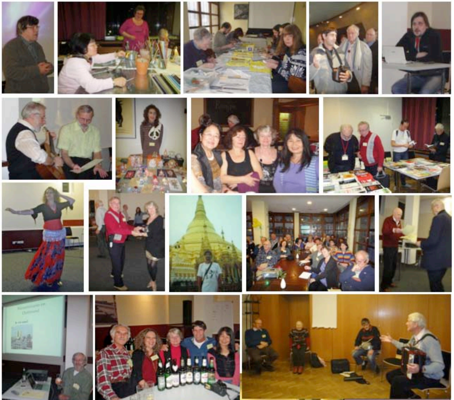
La 29a INTERNACIA FESTIVALO