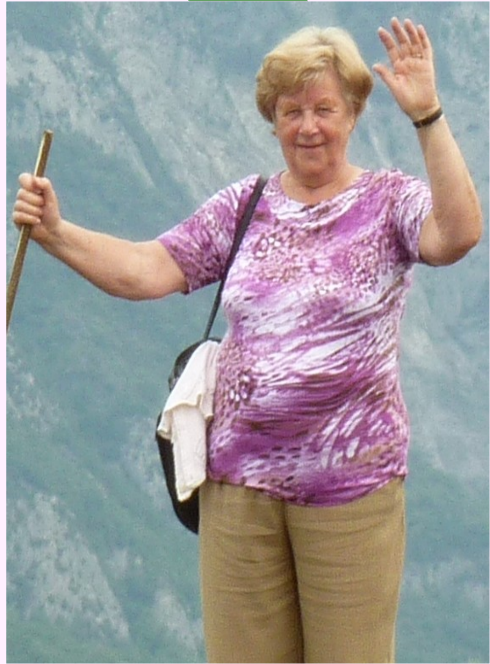
Membro de EBG - Esperantista Brusela Grupo