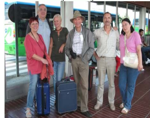
Kunaj flugantoj Bruselo-Barcelono

trioblighas pro alveno de turistoj. Dum la vintro multaj hoteloj ne funkcias.