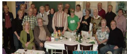
Zam-festoj 2009 en Oostende kaj Tienen.

Por festi la 15an de Decembro, tago de Zamenhof, La Hirundo, klubo de Tienen festas sabate la 10an vespere; La Konko, klubo de Oostende, festas dimanĉe la 11an ek de la finmateno; Antverpena Verda Stelo festas vendrede la 16an; nia E-Brusela Grupo festas sabate la 17an ek de la finmateno; kaj la klubo de Liège festas marde la 20an ek de la 17h30. Bondezirojn de bonaj festoj al ĉiuj!