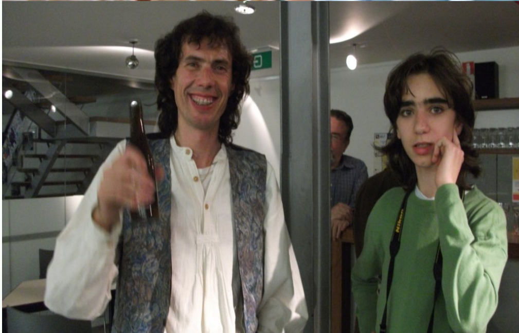
Novaj redaktistoj de nia bulteno "Aktuala Esperanto" ek de la venonta numero