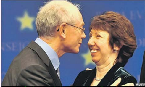
Catherine Ashton kun Van Rompuy

gardas ne nur sian povon sed ankaŭ la aliron al televidkameraoj. Ili ne volis fortan unuan prezidanton de la Eŭropa Unio.