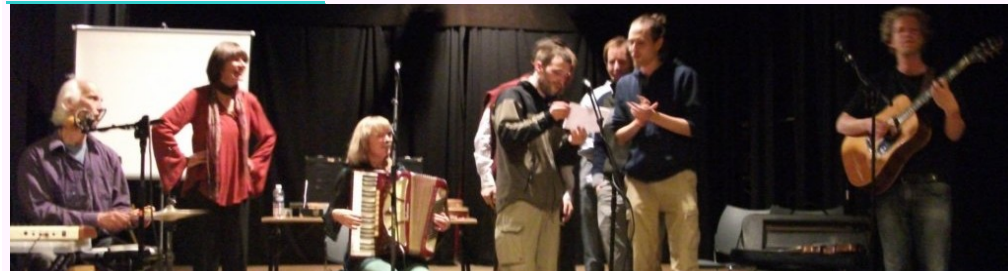
Koncerto de Kapriol vendrede, la 15an de Aprilo, 20an horo, donacita de EBG en Kulturcentro Maalbeek, 97 rue du Cornetstraat : http://br11.leadhoster.com/110415/