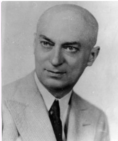
Kálmán Kalocsay (1892-1976)

Kálmán (Kolomano) Kalocsay ( ka'lma'n KAloçai ) (6-a de oktobro 1892 en Abaujszántó – 27-a de februaro 1976) estis hungara Esperanta poeto, tradukisto, kaj redaktoro kiu multe influis la evoluon de Esperanto-literaturo kaj de la lingvo mem. Liaj pseŭdonimoj: C. E. R. Bumy, Kopar, -y, Alex Kay, K. Stelov, Malice Pik, Peter Peneter . Kalocsay studis medicinon kaj poste fariĝis la ĉefa infektologo ĉe grava Budapeŝta hospitalo. Onidire li lernis kaj Esperanton kaj Idon adoleske sed ekkliniĝis al la unua kiam li vidis pli grandan potencialon literaturan. Kalocsay skribis: " En 1912 mi funde trastudis la gramatikon kaj vortaron de Ido. Tiam mi sciis Idon same bone kiel Esperanton. Sed mi neniam partoprenis en la Ido-movado, nek verkis ion en Ido: mia interesiĝo estis pure lingva kaj ĉesis post la ellerno de mia Ido-libro. " En 1921, oni eldonis lian unuan originalan volumon poezian, Mondo kaj Koro . Plia jardeko pasis antaŭ la apero de lia kolekto Streĉita Kordo , kiun oni konsideras unu el la plej elstaraj kolektoj de originala poezio en Esperanto. Ankaŭ aperis Rimportretoj - spritaj rondelformaj poemoj pri pluraj tiamaj movadaj gravuloj. Plejmultaj pensas, ke li ankaŭ estis la verkinto de Sekretaj Sonetoj (erotika sonetaro) sub pseŭdonimo Peter Peneter.