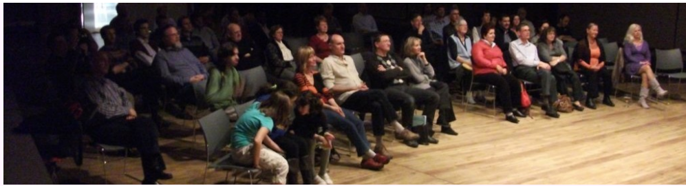
Gespektantoj de la koncerto de Kapriol vendrede la 15an de Aprilo