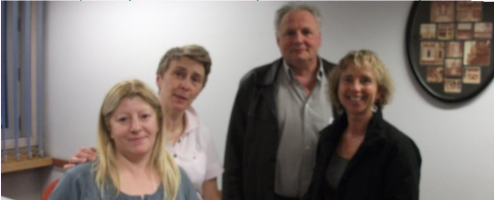
Komencanta enkonduka kurso la 6an de Aprilo