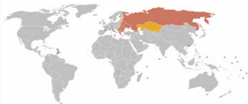
Geografia disvastigo de ortodoksismo