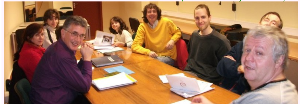
Progresanta perfektiga kunveno la 30an de Marto