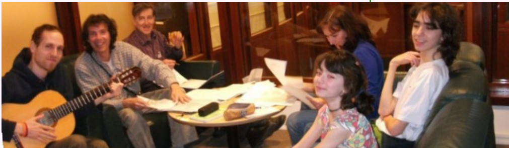
Progresanta perfektiga kunveno la 6an de Aprilo