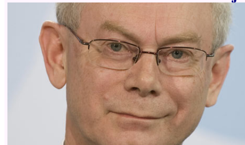
Herman Van Rompuy

Ekster Eŭropo oni surpriziĝis. Kiel oni povas elekti senvizaĝan nekonatan politikiston fronte al la monde konata kaj sperta Anthony Charles Lynton Blair, eksa ĉefministro de Britujo? Usonaj, japanaj kaj aliaj diplomatoj en Bruselo havas multe da malfacilaĵoj por klarigi, kiel Eŭropo faras decidojn pri la postenoj. Post tiom da militoj kaj pro tiom da nacia fiereco — certe de la grandaj Eŭropaj nacioj — ŝajne nepras elekti iun, kiu certe ne minacos, nek aŭdacos. Pli gravas, ke Eŭropaj ĉefoj plu venos al Bruselo kaj staros antaŭ la televidkameraoj.