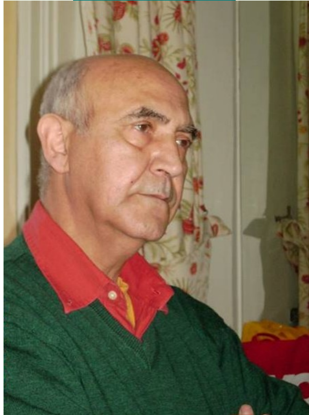
Membro de EBG, eŭropeista poligloto kaj tradukisto en la Konsilio de Ministroj de Eŭropa Unio