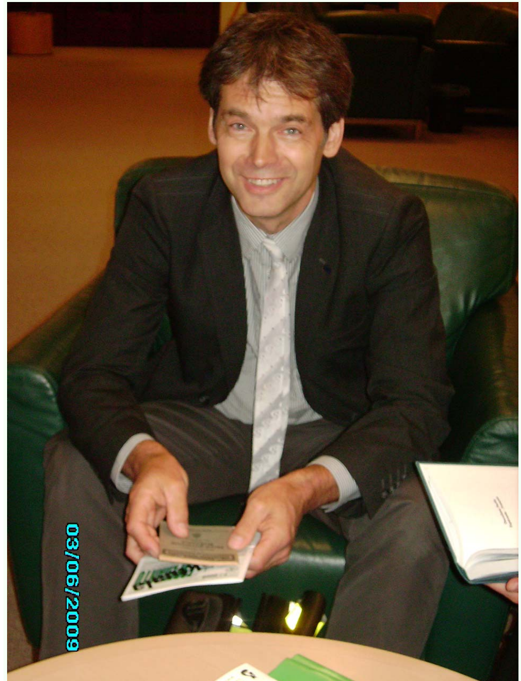
Unu el la plej aktivaj kaj fidelaj membroj de EBG