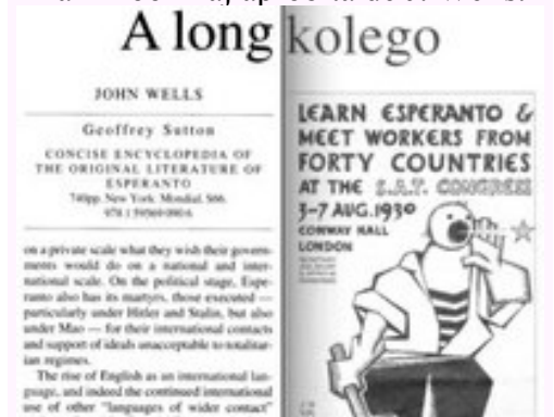
Geoffrey Sutton: Concise Encyclopedia of the Original Literature of Esperanto, 740 p. Libroservo de UEA: 48 eŭr.

Longa kolego en Times Literary Supplement. En 2008 aperis monumenta verko de Geoffrey Sutton pri la literaturo de Esperanto ( vidu apuda bildo ). Ĝi estas la ĝis nun plej ampleksa monografio pri la vasta temo, kaj iom mirinde, ĝi estas anglalingva. Kelkaj esperantistoj jam proponis, ke oni traduku la verkon "Concise Encyclopedia of the Original Literature of Esperanto" al Esperanto, sed kompreneble la anglalingva versio povas atingi multe pli grandan publikon, kiu ĝis nun tute ne konsciis pri la ekzisto de esperantlingva literaturo. Plian paŝon direkte al sia potenciala publiko la elstara verko faris la 6-an de februaro, kiam en la pinte prestiĝa literatura revuo Times Literary Supplement aperis ampleksa recenzo de John Wells. Libera Folio publikigis la kompletan tekston de la recenzo. La traduko estas farita de Brian Moon kaj aprobata de J. Wells.