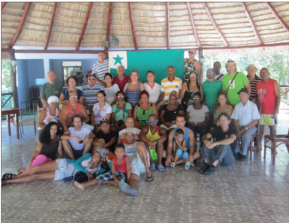
Partoprenintoj paŭzas por la grupa foto, memoraĵo pri bona E-renkontiĝo ĉi-foje en la feriejo Los Cantiles, kun alloga programo, en rava naturo, kiu jam fariĝis tradicia kaj kun ĉeesto de esperantistoj el pluraj provincoj.