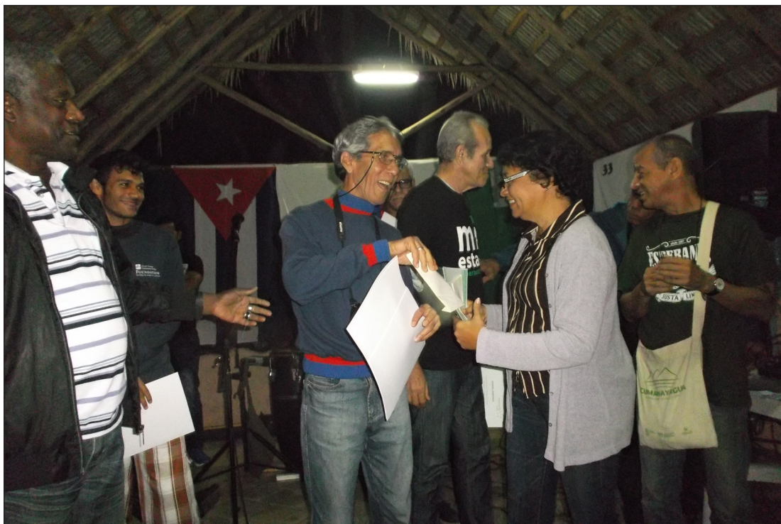
"Honor, honoras": Gratulo al instruistoj kun plej bonaj rezultoj dum 2016.

La programo de KERo ekis la 17-an per Seminario pri Informado kaj grafika propagando; ankaŭ okazis ateliero pri "Kiel protekti kaj konservi nian heredaĵon"; samtempe sesiis paroligaj kursoj, gviditaj de Juan Carlos Montero Medina kaj Cirilo Ramos Piñero, ankaŭ bazaj kaj mezaj ekzamenoj de