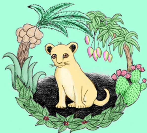
La vegetara leono

ilustraĵoj, tiel ke vi certe ekamos la kuraĝan leonidon. Ĉu vi miras, ke mi konsideras lin kuraĝa? Jes, laŭ mi kuraĝulo li estis, ĉar necesas kuraĝo por elekti sian propran dieton kaj firme realigi drastan admirindan ŝanĝon en sia vivo.