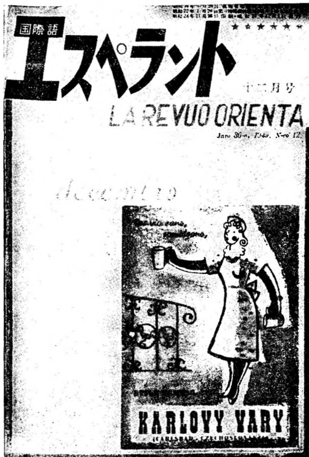
Titulni list japonské revue esperantské, propagující Karlovy Vary.