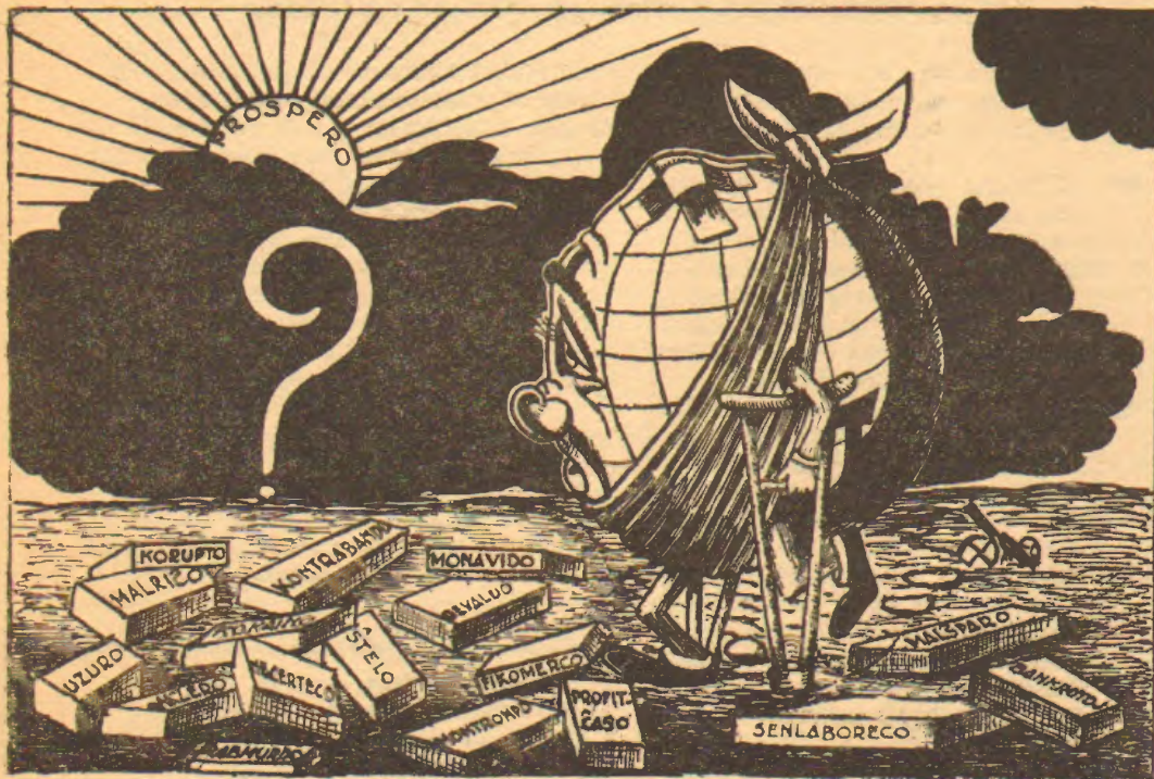
La kuracilo: „Forigo de tiuj ĉi erarigaĵoj“

EKONOMIO KAJ FINANCA PROFITO estas kontraŭaj konceptoj.