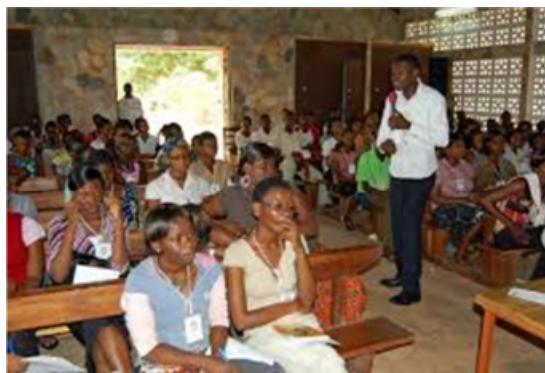
Maldekstre: La planata seminario salono (SPAMujo); dekstre: Instruado en Vogan.