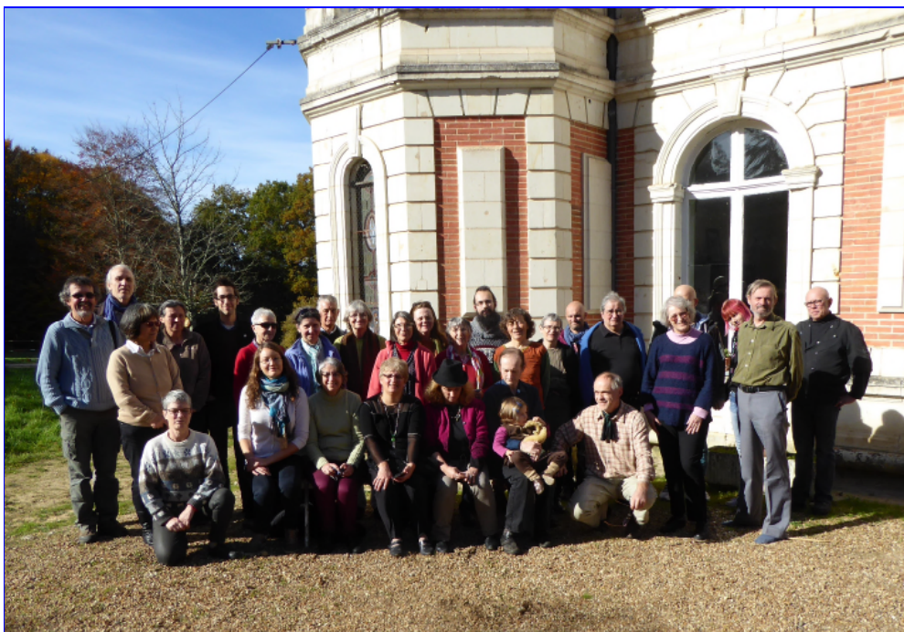
Staĝantoj, helpanoj, kantantoj, AM-antoj fine de la aranĝo: Fotoj: Martine Freydier

Ne hezitu en interparoloj citi personan sperton pri la supraj temoj – ofte tio pli konvinkas ol teoriaj aŭ ĝeneralaj proklamoj. En interparolaj situacioj ne nur prediku, sed interparolu por rapide aŭdi la interespunktojn de informpetanto; tio influos la uzotajn argumentojn.