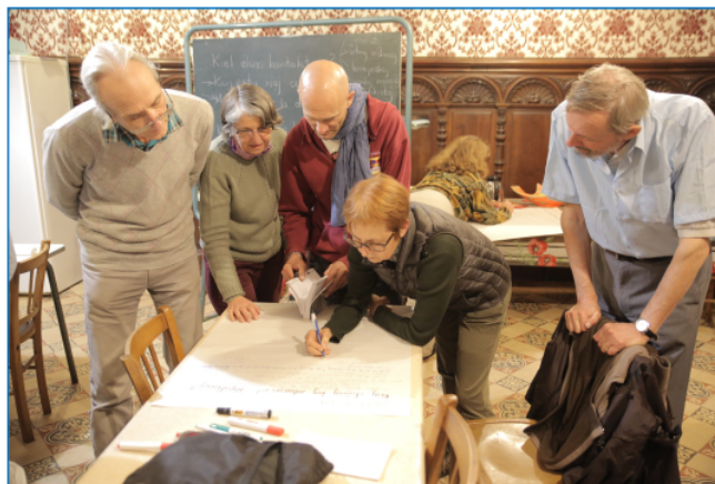
"En kafej' numero kvar..."

Pri etapoj tri kaj kvar ni raportos en seminarifina komuniko.