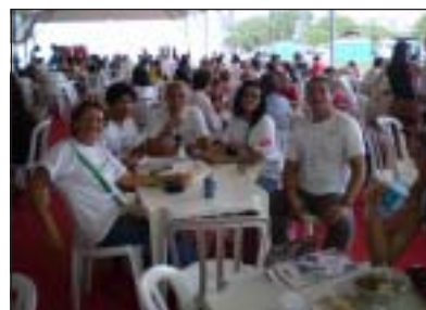
Esperantistoj ĉe la Monda Socia Forumo en Brazilo ankaŭ malstreĉiĝis (vidu paĝojn 1 kaj 2).

• Simpozio pri plurlingvismo La asocio Eŭropa Observejo pri Plurlingvismo ĵus anoncis sian 2-an simpozion. Ĝi okazos de la 18-a ĝis la 19-an de junio 2009 en Berlino. (Vidu pli ĉe http://plurilinguisme.europe-avenir.com/index.php ). La ĉi-jaraj temoj estos: • Kiel protekti la lingvan diversecon kaj samtempe eblegi interkomunikadon en Eŭropo, kaj eviti uzon de senkultura komunikilo? • Al vera plurlingva edukado de elementa lernejo ĝis universitato (La Observejo, diras ke la Komisiono proponis la formulon “1 + 2”, t.e. hejmlingvo + 2 fremdaj lingvoj, sed tio kondukis al: hejmlingvo + la angla + 1 fremda lingvo. • Lingvaj strategioj en la firmaoj. □