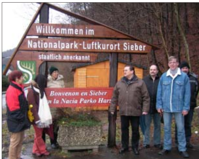
'Bonvenon en Sieber en la Nacia Parko Harz' nun legeblas en Esperanto dank' al la agado de lokaj esperantistoj en Germanio.

The February/March issue of The Linguist (Vol.1, No.1, 2009; www.iol.org.uk ) published an excellent feature entitled A way