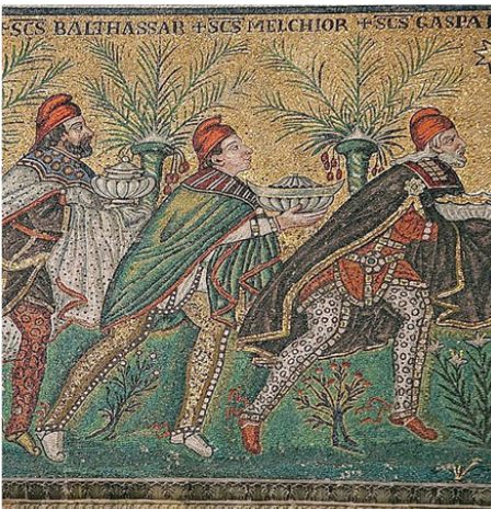
La magoj kun donacoj, 6a jarcento, Sant'Apollinare Nuovo, Ravenna

Anĝeloj, kiuj adoras Jesuon aŭ muzikas, estas oftaj rolitoj sur la bildoj. La paŝtistoj kaj la magoj ofte estas samtempe sur la bildoj, kvankam ili estas la rolitoj de