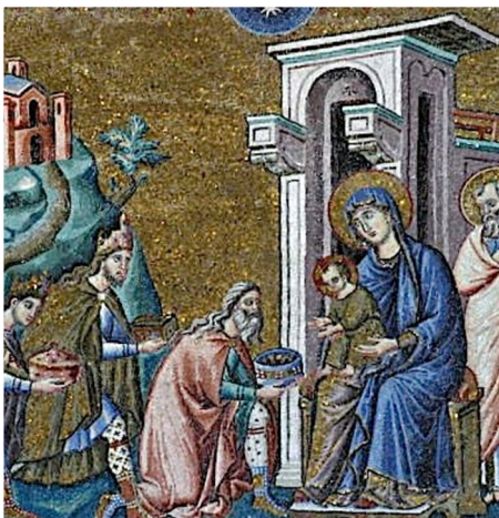
12a jarcento, Romo, Santa Maria in Trastevere, mozaiko

En la 14a jarcento franciskana monaĥo skribis sian vizion per la titolo