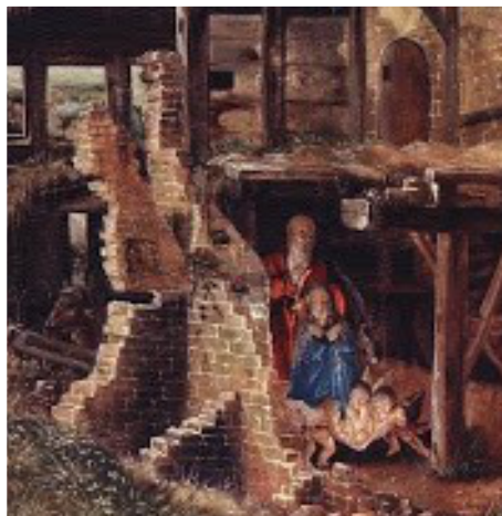
Albrecht Altdorfer (1480–1538): Naskiĝo de Jesuo