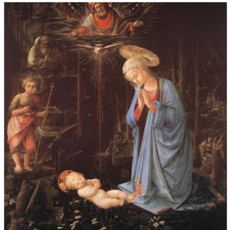
Fra Filippo Lippi (cca 1406–1499): Adorado de Jesuo