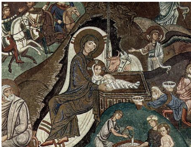
Bizanca mozaiko, Palermo, 1150