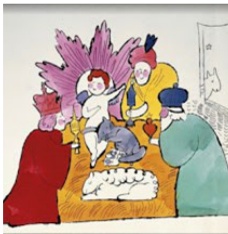
Andy Warhol (1928–1987)

Je la fino de mezepoko ofte oni metis la scenon de la Naskiĝo al civila loko, al ĉambro, kie Jozefo kaj la akuŝistinoj agadas ĉirkaŭ Maria kaj la bebo. Pli poste la akcento transmetiĝis al la paŝtistoj aŭ al la omaĝo de la magoj, kiuj dumtempe pli kaj pli fariĝis reĝoj. ☞