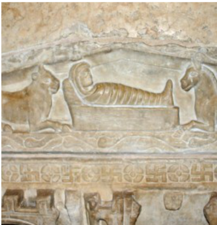
Sarkofago el la 4a jarcento, Milano – unu el la plej fruaj prezentoj

La du bestoj ne rolas en la evangelio de Luko, pri ili la fonto estis Jesaja 1,3: