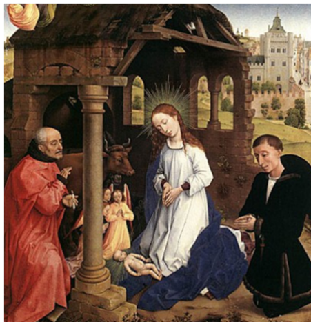
Rogier van der Weyden (1400–1464): Naskiĝo de Jesuo. Sur tiu ĉi bildo la mendanto de la bildo, la princo de Burgonjo estas "partoprenanto" je la naskiĝo de Jesuo, li genuas en la dekstra flanko de la bildo

diversaj epizodoj. La pluraj floroj de la malfrua mezepoko (ekzemple lilo, irido, rozo, kamomilo, lavendo) ne nur estas dekoraĵoj, sed estas simboloj de Maria aŭ Jesuo.