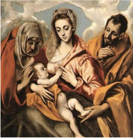
El Greco (1541–1614): la Sankta familio kun Sankta Anna