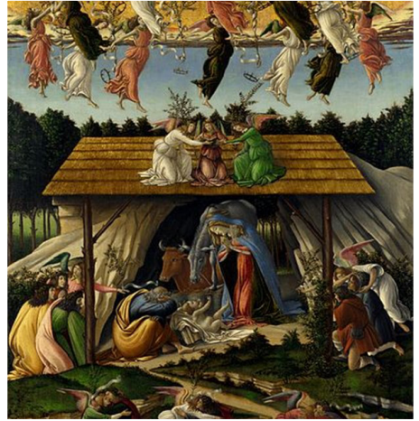
Sandro Botticelli (1445–1510): La mistika naskiĝo de Jesuo

MEDITADOJ PRI LA VIVO DE KRISTO [org: Meditationes Vitae Christi ]: Maria sen doloro, apogante sin al kolono naskis sian infanon. Ekde tiam ankaŭ kolono aperis sur la bildoj, eĉ la loko fariĝis al la ruina palaco de Davido en Betlehemo.