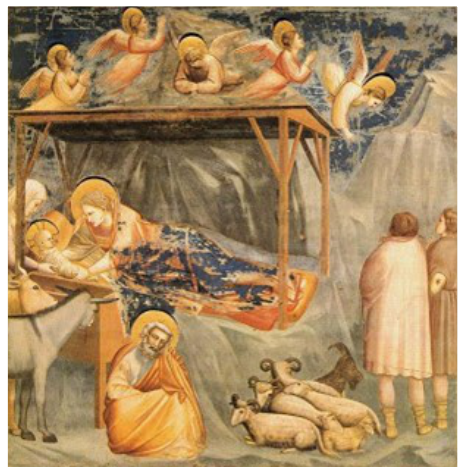
Giotto (1267–1337), Naskiĝo de Jesuo, Padova, Arena-kapelo