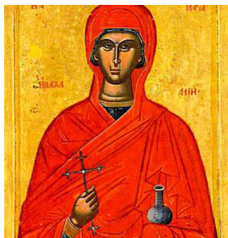
Bizanca ikono pri ŝi, kiel mirha portanto (14a ĝis 17a jc)