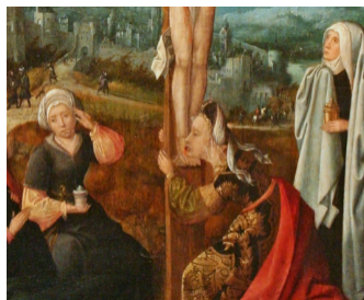
Ĉe la kruco, Majstro of Hoogstraeten (ĉ. 1475–ĉ. 1530)