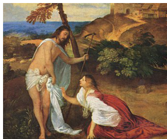
Ticiano: "Noli me tangere", ĉ. 1512