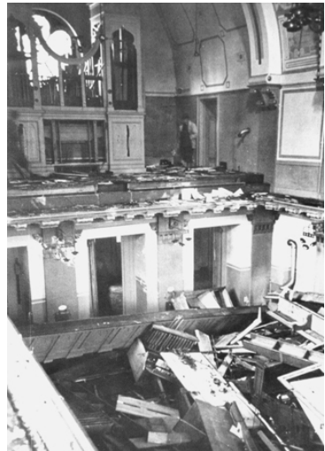
La interno de la detruita sinagogo dum la Kristala nokto en Pforzheim

La Kristala nokto ekigis novan fazon de kontraŭjudaj agoj de nazia registaro. Antaŭrimedojn por realigi la elmigradon kaj, fine, la ekstermadon de la juda popolo entreprenis la nazioj sen justa proceso.