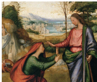
Fra Bartolomeo: "Noli me tangere", [Ne tuŝu min] ĉ. 1506