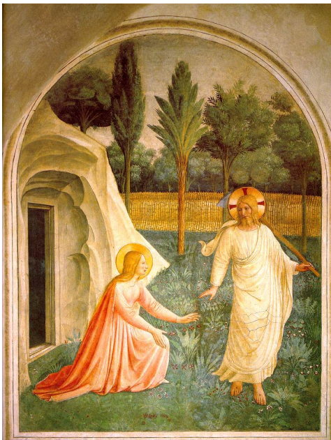
Maria Magdalena, Noli me tangere , [Ne tuŝu min], fresko de Fra Angelico laŭ Joh 20:14-17

Post kiam la animo pasis la trian potencon, ŝi plu iris supren kaj ekvidis la kvaran potencon. Tiu posedis sep figurojn. La unua estas mallumo, la dua dezirego, la tria sencio, la kvara estas mortiga envio, la kvina la regado de la karno, la sesa estas la stulteco de karna saĝeco, la sepa estas kolerega saĝo. Tio estas la sep (potencoj) de la kolero.