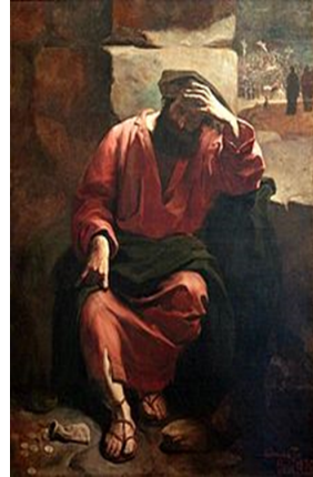
Detalo de mura pentraĵo pri la memmortigo de Judaso Iskariota

La plej ofta situacio, en kiu artistoj pentris aŭ skulptis lin, estas la momento de la perfida kiso, aŭ li estas montrita kiel simbolo de malbona konscienco – kun la tridek arĝentaj moneroj.