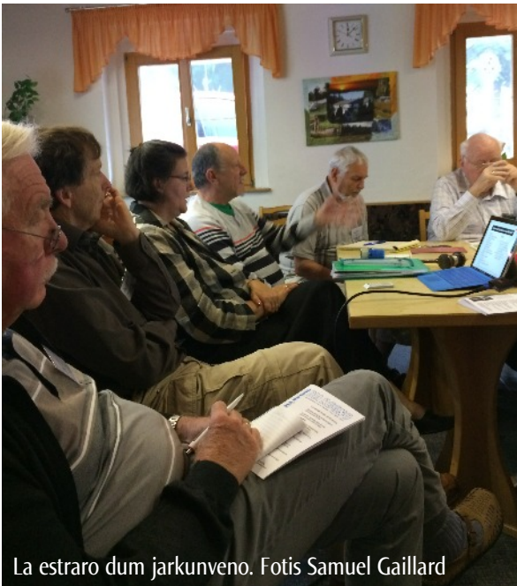
La estraro dum jarkunveno.