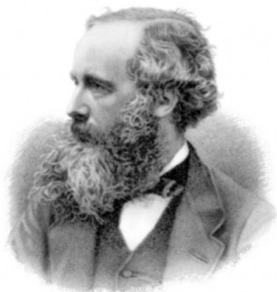
Maxwell 1831 – 1879