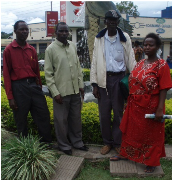
La salutanto staras due de maldekstre kun kelkaj geesperantistoj Kristanoj.