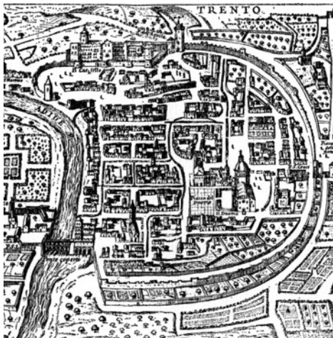
Trento dum la 16a jc (kopio farita en la 18a jc)

“Trento estas kaŝejo por Germanoj kaj rifuĝejo por Italoj ĉi-tien alkurintaj por eviti siajn misfortunojn. Somere la klimato estas sufoke varma kaj, pro la nombraj kanaletoj fluantaj laŭ la stratoj, la aero estas malseka kaj ne salubra. Vintre neĝo kaj glacio igas la urbon neloĝebla ĉar la kanaletoj frostiĝas kaj