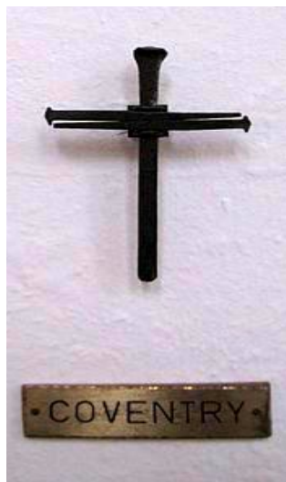
Najlkruco 1947 por Kiel