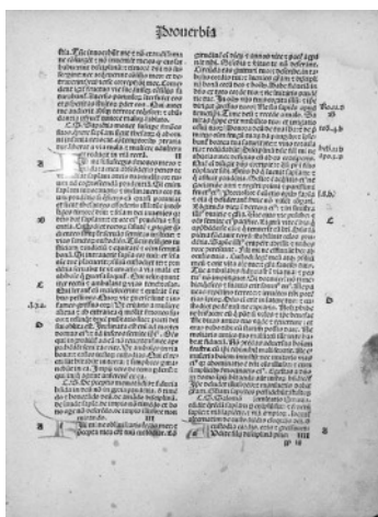
Biblio de la jaro 1497

En la naciaj bibliotekoj de la eŭropaj landoj bibliofilo povas admiri inkunablojn en la respektiva ŝtata lingvo. Ekzemple en Nederlando gastoj estas bonvenaj en Reĝa Biblioteko en Hago, kie konserviĝas 2144 inkunabloj.