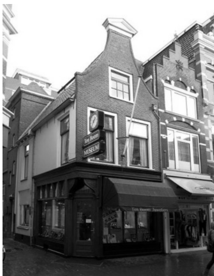
La domo nuntempe estas muzeo.

Oni kalkulas ke Corrie kaj la aliaj anoj de ŝia familio kune kun iliaj multaj geamikoj savis la vivon de pli ol 800