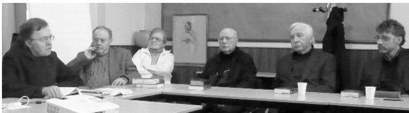
Dum prelego de patro Willibald Kuhnigk.