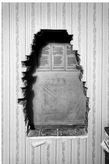
La falsa muro kun la malantaŭa kaŝejo

La anoj de la ten Boom familio estis tre dediĉataj kristanoj. Ilia hejmo ĉiam estis malfermita al senhavaj personoj. Ili estis tre agemaj pri societa laboro.