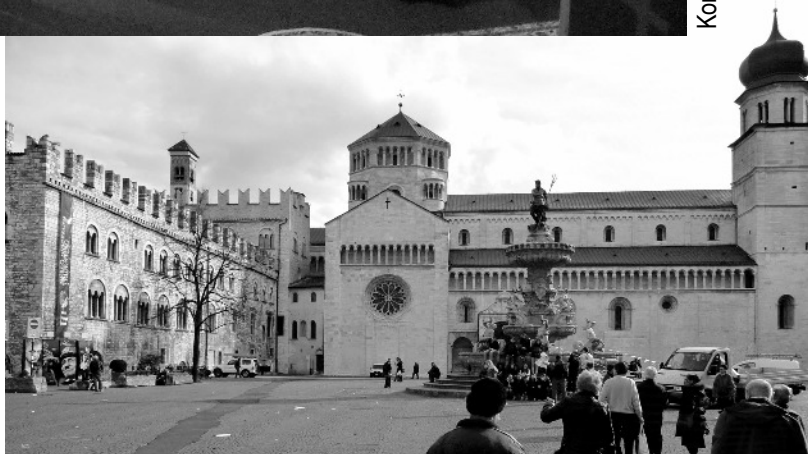
Katedralo en Trento