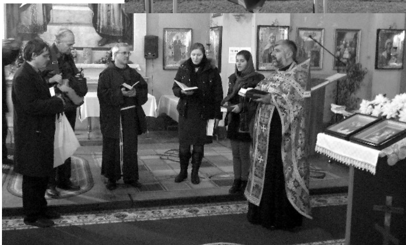
Komuna kantado kun ortodoksuloj