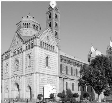
La katedralo en Speyer

Al la diservo kaj la posta solenaĵo muzike kontribuis la ensemblo “Spira spiralo”, en kiu membras Eberhard Cherdron, la antaŭa episkopo de la palatinata protestanta landa eklezio, kaj lia edzino. Kvankam ne plu regule per diservoj en la Afra-kapelo de la katedralo de Speyer, la laborunuiĝo ankaŭ estonte volas kontribui, ke homoj en komuna lingvo, en la lingvo de d-ro Zamenhof, renkontiĝu, kompreniĝu kaj preĝu transe de limoj landaj, kulturaj kaj religiaj.