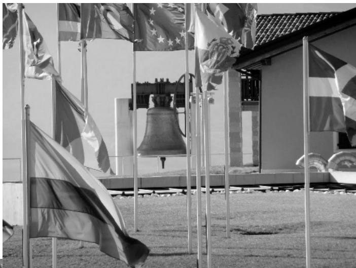
Sonorilo de la Paco