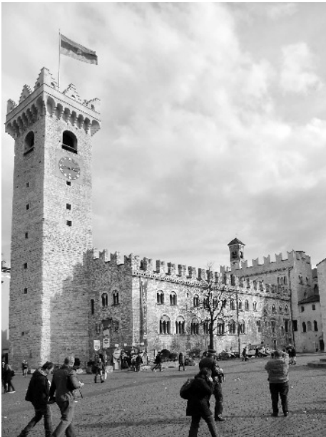
La dioceza muzeo en Trento