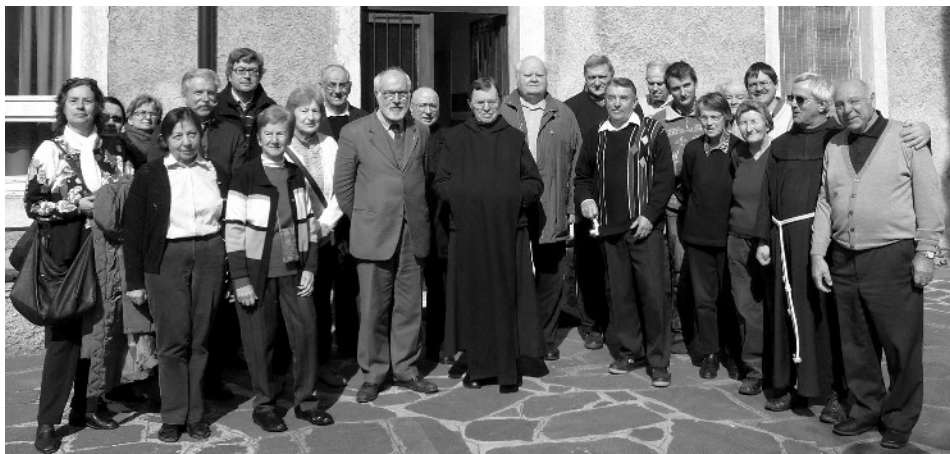
La grupo dum la bibliaj tagoj en Trento