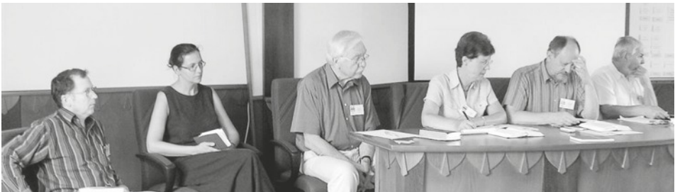
Estraranoj dum la jarkunveno 2010 en Beregdaróc.

Mi esperas, ke ni dum la jarkunveno de KELI aŭdos pli detale pri aliaj landaj sekcioj kaj grupoj, kiuj aktivas, sed nenion informas... ☞