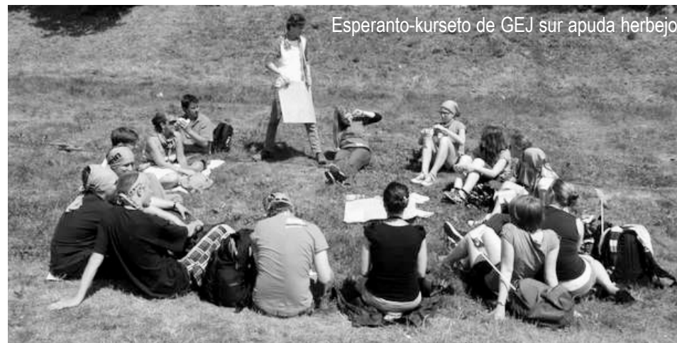
Esperanto-kurso de GEJ sur apuda herbejo