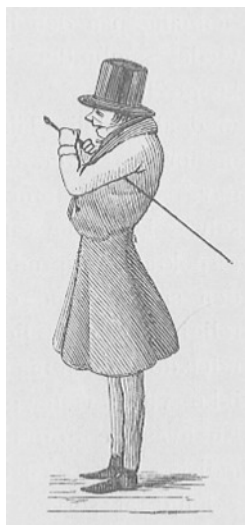
Karikaturo montrante Kierkegaard

Ies respondo estas same bona kiel tiu de iu alia. Kaj tio estas via subjektiva vero. Dum siaj lastaj jaroj Søren multe protestis kontraŭ tiuj kiuj en sia profesio aŭ posteno opiniis ke ili havas pli bonan veron ol aliaj. Pripensu kiom vi fakte scias. Plejmulte