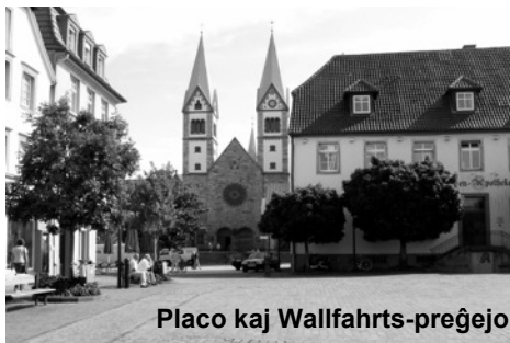
Placo kaj Wallfahrts-preĝejo