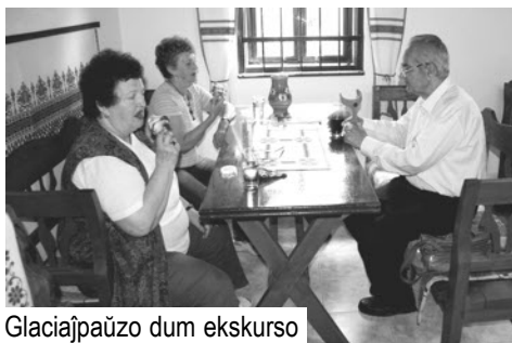
Glaciajpaŭzo dum ekskurso