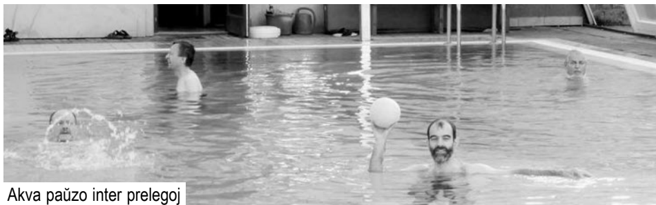
Akva paŭzo inter prelegoj