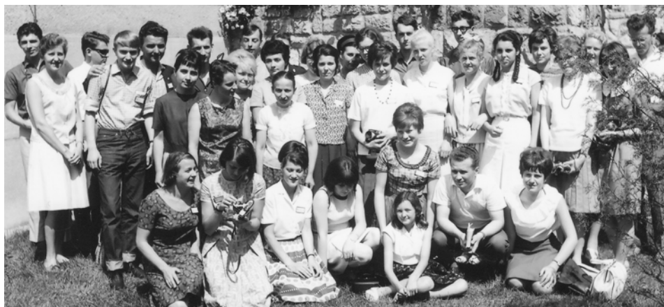
Debrecen 1966, KELI-kongreso