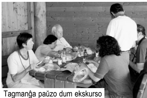
Tagmanĝa paŭzo dum ekskurso