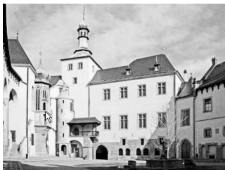
Urbo Kutná Hora