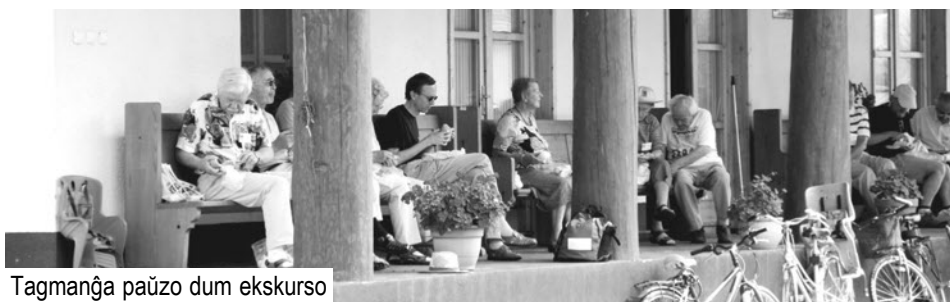
Tagmanĝa paŭzo dum ekskurso