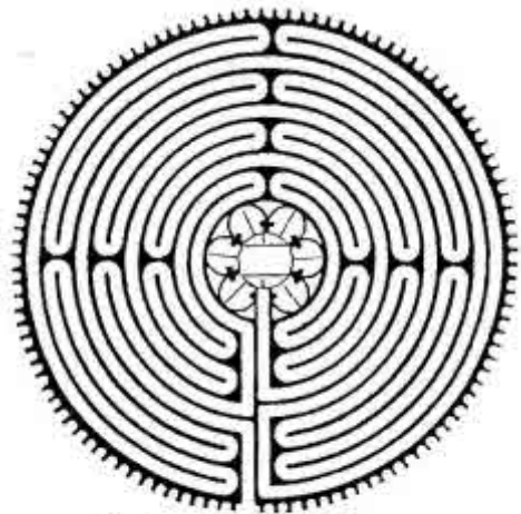
Chartres (1216) 294 m longa Kirchberg, (2006) 350 m longa

La diametro de la labirinto estas 20 metroj. Sur 11 paralelaj cirklaĵoj oni trapasas 28 vojkurbiĝojn ĝis la celo post 350 m estas atingita. La meditante ĉirkaŭas survoje al la centro plurfoje la celon. Li kelkfoje estas devigata sekvi direktojn, kiuj ŝajnas gvidi for de la celo. Sed restante sur la vojo sen reiro, li atingos sur la vojo la centron. Por mezepokaj kristanoj labirinto estis parabolo de la homa vivo kun ties ekzamenoj, kromvojoj, restadoj