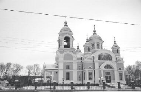
La templo, dediĉita al Sergij Radoneĵskij de la urbo N.Tagil

kiam komunistoj festis 50 jarojn de revolucio).