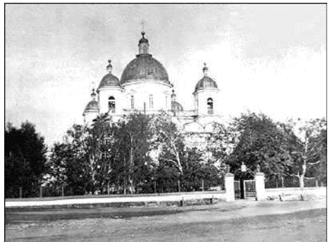
Vijsko-Nikola templo de N. Tagil. La templo estis en nia urbo. Estis ruinigita dum la soveta periodo.

La bela templo similas al la templo, kiu iam estis en la alia distrikto de nia urbo kaj kiu estis ruinigita dum la Soveta periodo (sur tiu loko nun staras palaco “Jubilejnij”, konstruita en 1968