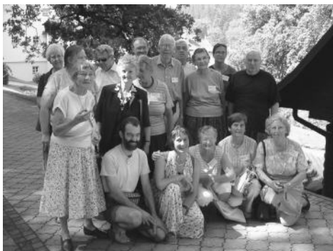
Kelkaj el la aro de partoprenantoj en la 2004a KELI-kongreso

Esperanto-Misio ne plu funkciis. La problemo de la restanta materialo ne estas solvita.