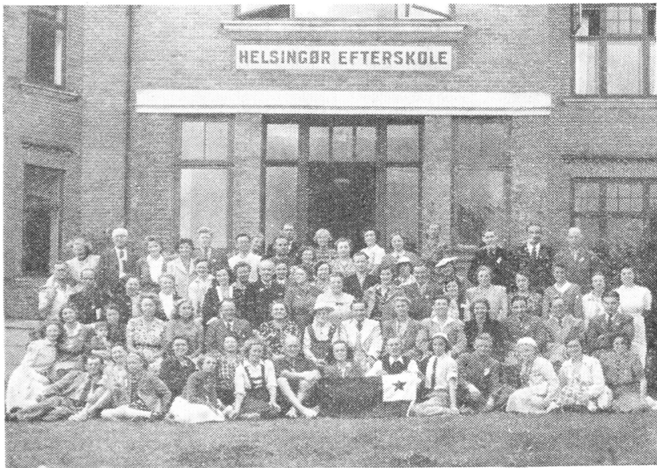
Sommerkursus i Helsingør 1946.