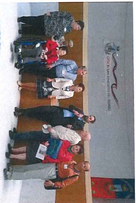
Gazetara konferenco en la urbdomo.

Sabate okazis en la urbdomo gazetara konferenco kun partopreno (flanke de IFEF) de unu reprezentanto de ĉiu lando, el kiu venis (ĝis tiam) kongresanoj. Post la konferenco Vito diris, ke ne estas granda eĥo, sed tamen estis en i.a. la regiona televido sufiĉe ampleksa kontribuo pri la kongreso.