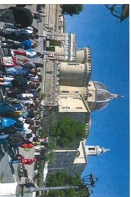
Loreto, unu el la ekskursceloj.