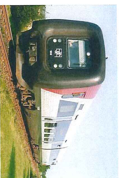
ft-trajno, IC2-tipo, sur la insulo Lolland

Midttrafik (posedaĵo de la regiono Mez-Jutlando kaj la komunumoj en la regiono) posedas Aarhus Sporveje Busselskabet (aŭtobuskompanio, kiu veturigas la enurbajn busojn en Aarhus ) kaj la akciplimulton en Midtjyske Jernbaner (Mez-jutlanda fervojkompanio) kiu eksploatas Odderbanen (HHJ) kaj Lemvigbanen (VLTJ) .