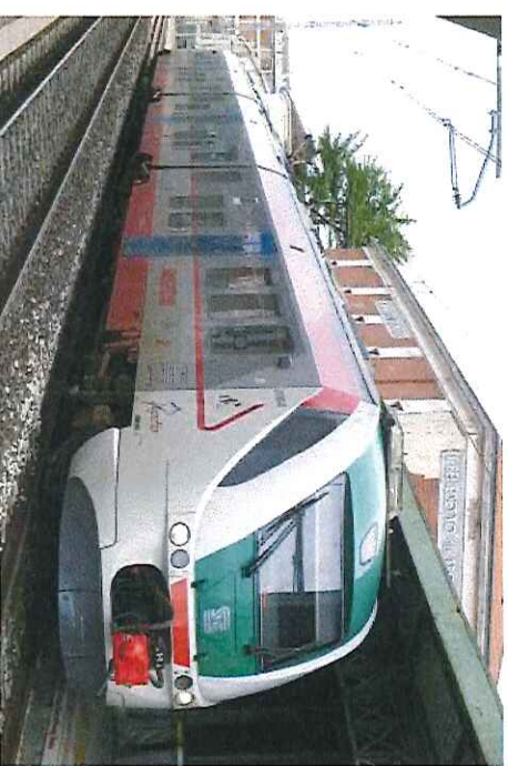
Regiona trajno.

Ni estis en la stacidomo – kaj ankau en la urbdomo, kie la model-fervoja fako de dopolavoro (fervojlibertempa asocio itala) ekspoziciis dum la tuta kongresa semajno.