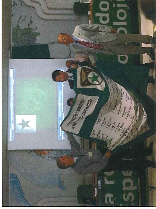
Je la fermo de la 66a IFK – transdono de la flago al Ĉinio, kiu organizos la 67an IFK-on en 2015.