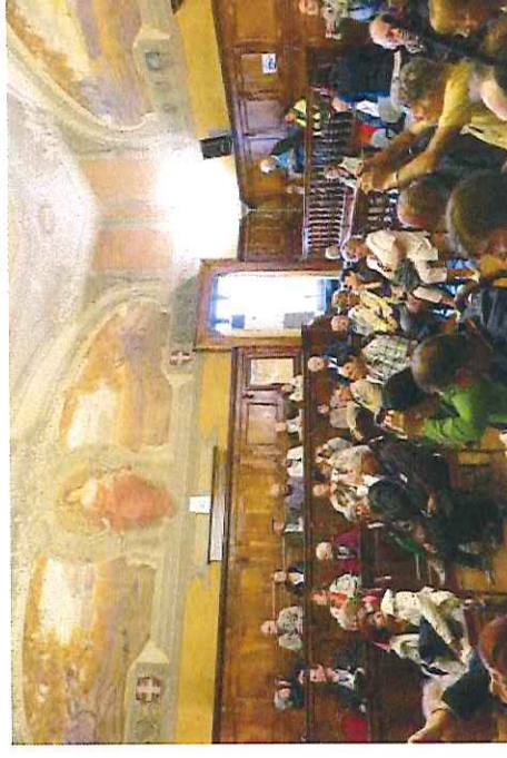
Akcepto en la regiona ĉefurbo Ascoli Piceno.

FIRST , skota firmao, kiun ni en Danio tre bone konas de sia 'aventuro' sur la Marborda Linio ( Kystbanen ), estas A/S , akci-kompanio, sed eniras ofte kontraktojn kun naciaj entreprenoj kiel ekzemple DSBFirst ( First 25-30%, DSB la resto) kaj First Transpennine Express ( First 55%, la resto Keolis )