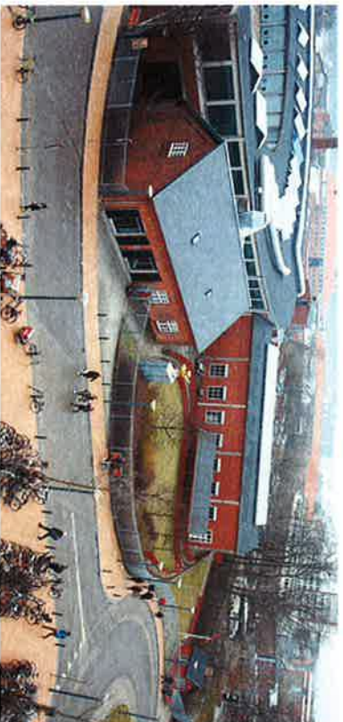
Dana Fervojuzeo, Odense.

En septembro aŭ oktobro DEFA ekskursos per trajno al la dana fervojuzeo en Odense. Ni antaŭvidas planon pli-malpli tiel: