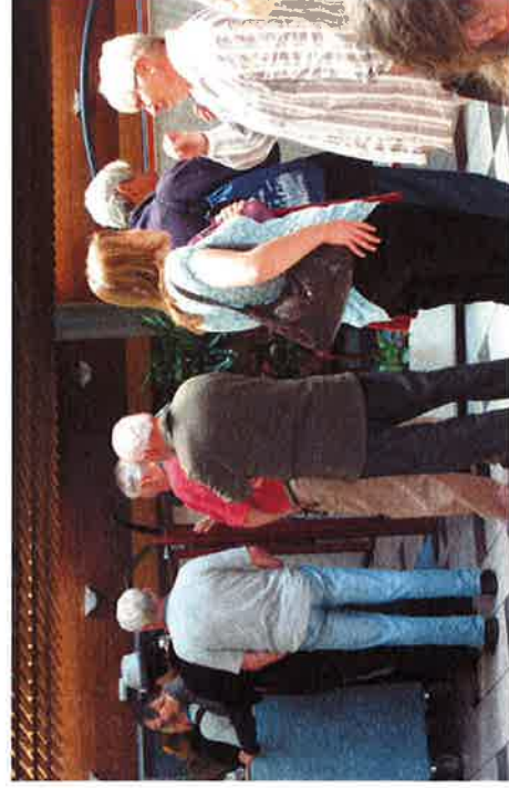
Plusa sperto: dum vicostarado en la memserva restoracio oni babilis!