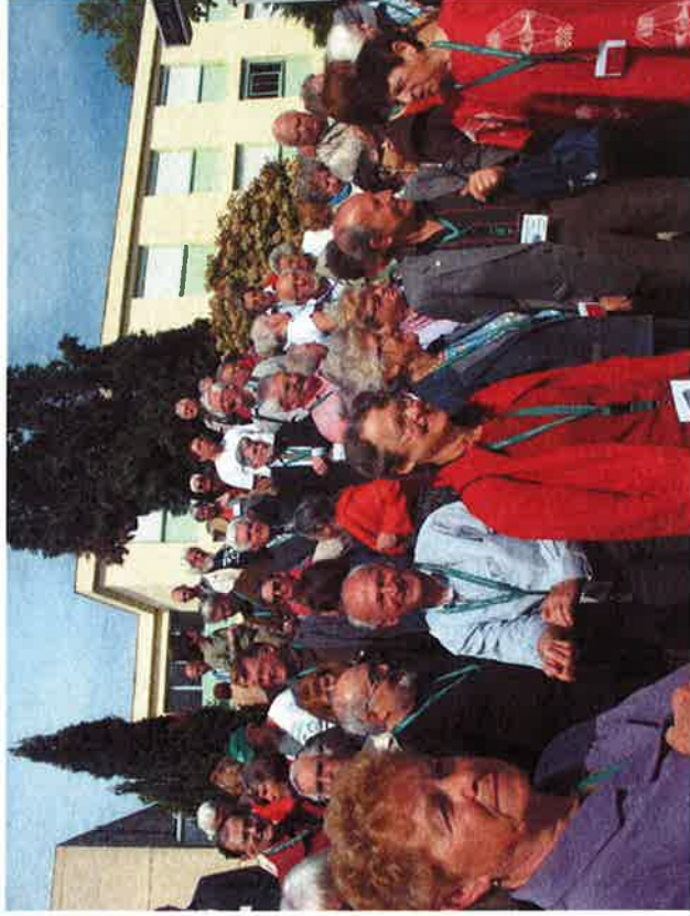
Post la inaŭguro ... la tradicia komuna foto

Ambaŭ organizoj profitis de tiu arango. Ni kune pli multis ol solaj, - ni estis entute ĉ. 230 personoj. La prelegoj estis pluraj kaj pli variaj, ol ni povus sole fari ... laŭ fakaj temoj kaj laŭ aliaj temoj. Kaj, ne malpli grave, ni ĉiuj - de ambaŭ flankoj - renkontiĝis ne nur kun amikoj jam konataj, sed ankaŭ kun NOVAJ AMIKOJ. Kiel oni diras en nia moderna mondo: estas gajno-gajno-situacio.