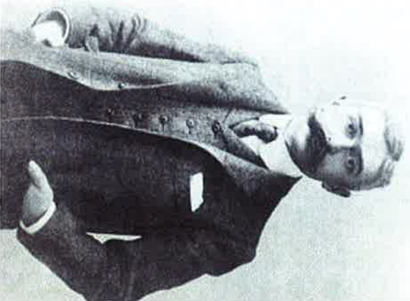
Pierre de Coubertin, 1863-1937

La idearon OLIMPISMO, kiu estas bazo de la modernaj olimpikaj ludoj, priskribis de Coubertin. Se oni faras sporton laŭ certaj, fiksitaj reguloj kaj leĝoj, oni lernas defii sin mem, korpe kaj anime, kaj en la internaciaj ludoj oni lernas respekti aliajn homojn, - oni lernas pri komprenemo, amikeco, honesteco kaj helpemo.