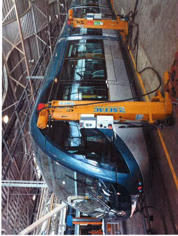
Faka ekskurso al la tramiparejo

Por ni estis bona afero esti en unu loko kun mallonga distanco inter loĝejo kaj kunvenejoj, kie ĉiuj estas ĉiam (preskaŭ) kune – tio donas la por ni ĝustan kongres-atmosferon.