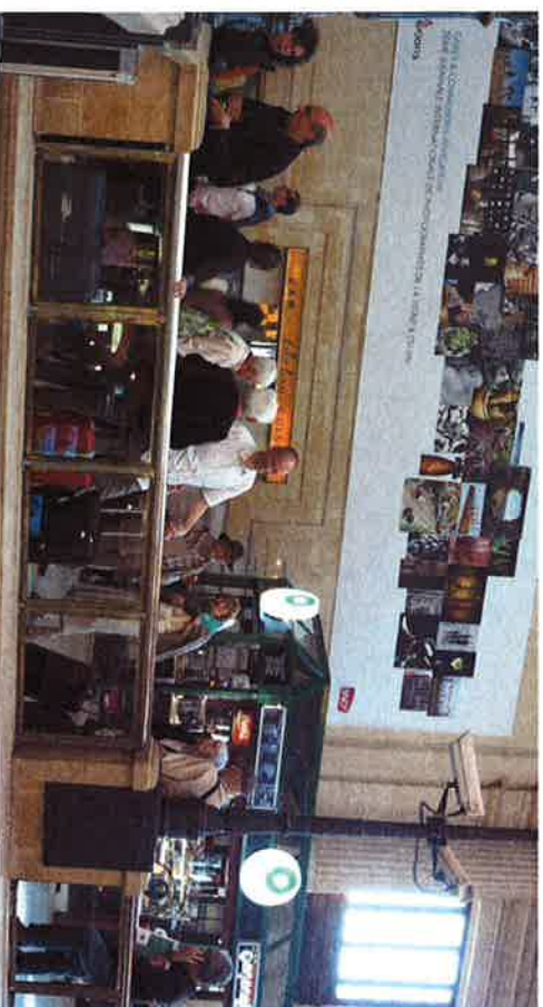
Je la alveno en la stacidomo en Bordozo – ni estis akceptitaj kaj akompanataj al la kongresejo.

Ankaŭ ĉijare la kongreso de IFEF estis rezulto de kunlaboro, nome inter la franca esperanto-asocio UFE kaj IFEF, kaj estis ne nur kunlaboro, estis KOMUNA KONGRESO. La IFEF-kongreso daŭris unu semajnon, kiel kutime, de sabato ĝis sabato, kaj ekde merkredo estis ankaŭ programeroj de la UFE-jarkunveno.