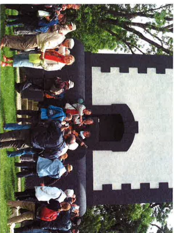
Kajto distras dum ekskurso

Ni ofte spertis, ke la francoj faras bonan kulturalan programon por iliaj aranĝoj. Ni partoprenis kelkajn kongresojn kaj cetero kelkajn skisemajnojn, - ĈIAM kun bona kultura programo. Ankaŭ en Ardigues. Koncerto, spektakloj, kvizo-ludo, ... kun granda partopreno de la loka teatra kaj kanta grupo de Esperanto-Gironde (Kompanoj), sed ankaŭ Interkant' kaj Kajto prezentis altkvalitajn programojn.