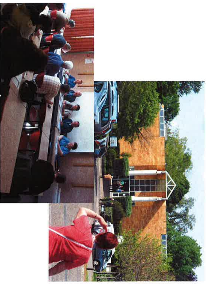
La kongresejo kaj unu el la kunsidoj de IFEF

... do, entute tre taŭga kongresio, kie oni povis ĉion fari en unu loko sen transporti sin multajn kilometrojn plurfoje tage.