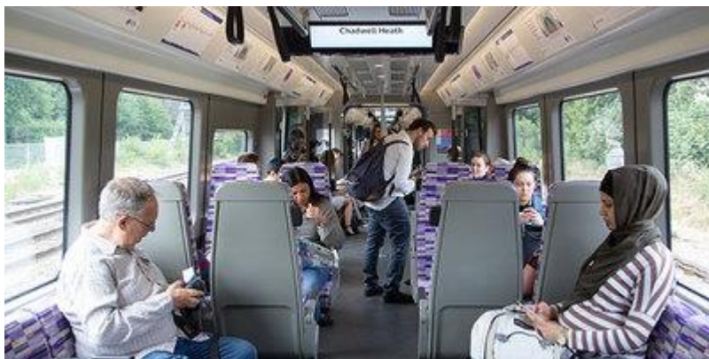
Interno de trajno

Per plibonigo de vojaĝtempo, malpezigo de la trafika denso kaj oferto de pli bonaj konektoj por Elizabeth Line oni havos pli facilajn, pli rapidajn kaj pli rektajn vojaĝeblecojn en la tuta ĉefurba regiono.