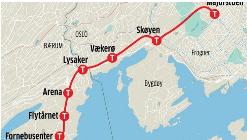
La itinero de la nova linio

La projektgrupo PGF ( ProjekteringsGruppen Fornebubanen ) havas dek jarojn por projekti kaj konstrui la metrolinion.