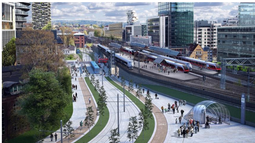
La centro de Oslo kun multaj transportiloj

Granda defio en la projekto estas ligo al la ekzistanta fervojlinio ĉe Majorstuen stacio. Majorstuen estas kruĉejo, kie oni devas konsideri la ekzistantan fervojon ( T-bane ). Estas grave, ke oni povas konstrui la novan linion, dum la ekzistanta ĉe la grava stacio plene funkcias. Ankaŭ nun oni devas jam pripensi, ke verŝajne Majorstuen stacion oni ligos al subtera pluretaĝa stacio por plifaciligi la trafikfluan en la centro de Oslo .