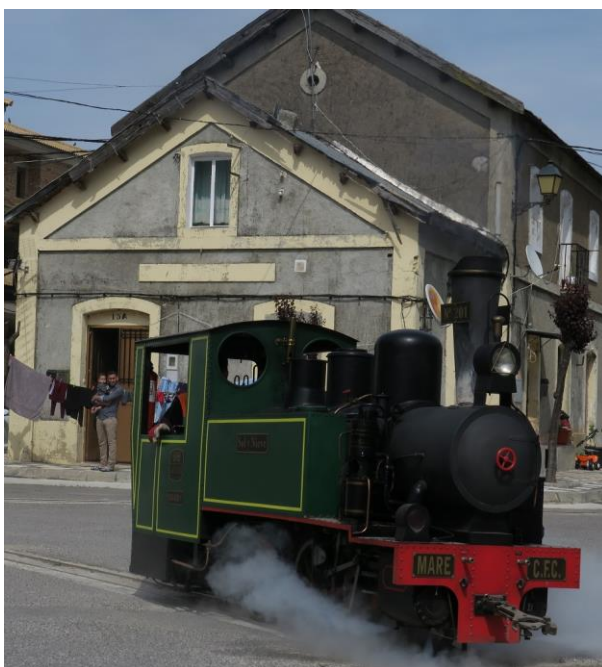
El tren del Llano en Ventas de Zafarraya.

La fakaj prelegoj dum la kongreso estis multaj kaj tre diversaj, kaj kiel kutime ili aperos kiel artikoloj en la venontjara eldono de FFK. Faka ekskurso gvidis al la montara vilaĝo Ventas de Zafarraya, kie ni veturis per la eta musea trajno.