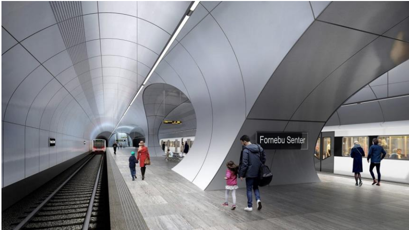
La planita finstacio Fornebu Senter

En la nuna plan-paŝo oni uzas BIM por fari 3D-modelojn.