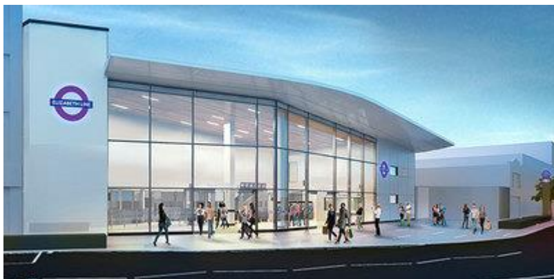
Unu el la novaj stacioj (laŭ la planoj)

La Crossrail -projekto estas momente konata kiel la plej granda infrastrukturprojekto en Eŭropo.