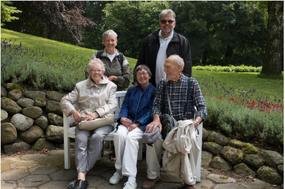
DEFA-anoj en la parko de Gavnø

Ni ŝipvojaĝis de Næstved kaj alvenis ĝustatempe por la lunĉo, kiun ni ĝuis en la kafejo. Poste ni visitis la kastelan muzeon, la preĝejon kaj promenis en la parko, kie floroj floris, ĝardenistoj laboris kaj vizitantoj admiris la tuton.