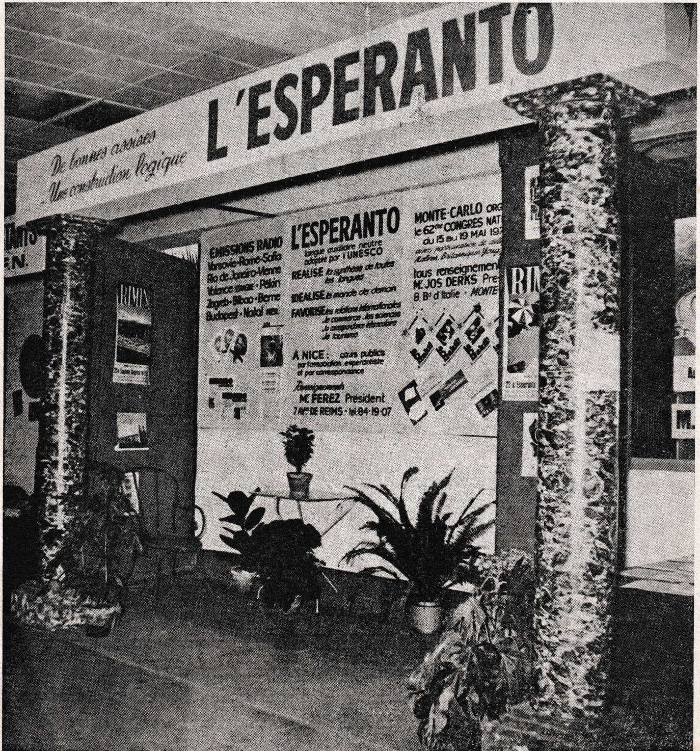
- FOIRE DE NICE - STAND OFFICIEL DE L'ESPERANTO 1970 -