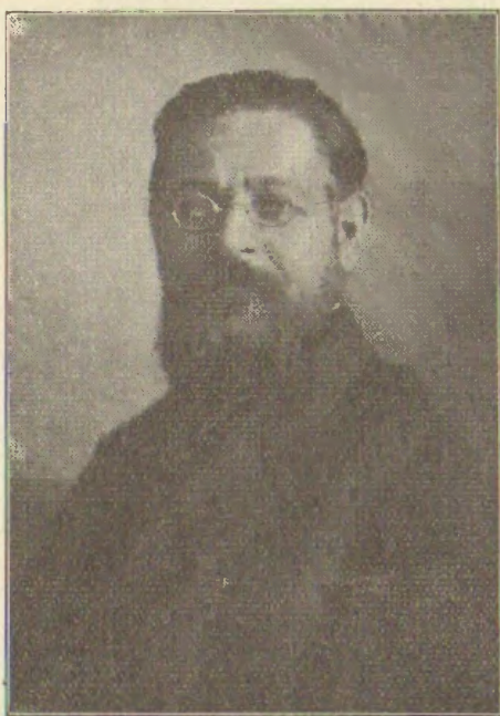
S-ro. Albert THOMAS Direktoro

ALBERT THOMAS, Direktoro de la Internacia Laboroficejo, Franco. Naskiĝis en 1878. Ano de franca Supera Normala Lernejo, fariĝis universitata agregaciulo en 1902. Antaŭa redaktoro de la socialista gazeto « Humanité », fondinto de la « Revue syndicale » en 1904, fariĝis deputito ĉe la franca parlamento en 1910. Reelektita en 1914, li fariĝis ministro de Armadoj en 1916, dum la milito. Post la milito, en 1919, li estis elektita kiel Direktoro de la Internacia Laboroficejo.