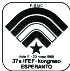
Urbdomo de Vejle