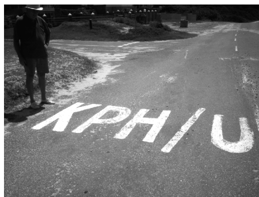
Supre: Malkorekta skribaĵo sur vojo.

La Metrika Sistemo (S.I.) estis plene legaligita en la Respubliko Sud-Afrika (RSA) en 1936, sed la loĝantaro neglektis ĝin kaj daŭrigis uzi la arkaikan anglan sistemon de mezuroj ĝis 1974, kiam ĝia uzo estis malpermesata. Ekde tiam sole la S.I. estis instruata en la lernejoj kaj ekskluzive uzata sur ĉiuj terenoj. Tamen kelkaj angleparolantoj daŭre kontraŭas ĝin en siaj koroj. Anstataŭ la korekta “km/h” ili skribadas “KPH” en kio la H signifas “hour”. En la metrika sistemo kontraŭe, la h staras por la latina hora kiel simbolo kaj ne kiel mallongigo. Opiniante ke H estas mallongigo el la angla lingvo, ili sentas sin devigata pludoni ankaŭ la mallongigon por la Afrikansa “Uur”. La signo KPH/U do konsistas el ioma parto de obstino kontraŭ la S.I. kaj el granda parto de stulteco, preskau analfabeteco.