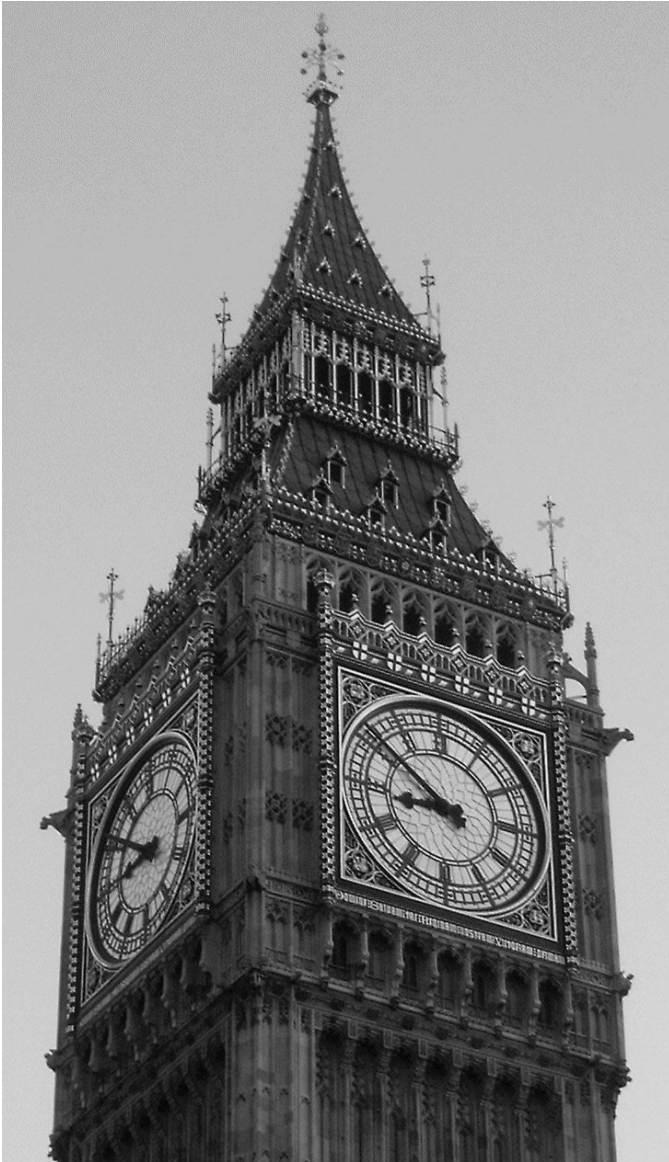
Supre: Big Ben, fotita de la aŭtoro.

Estis en Londono kie mi havis plej multe da libertempo – ni tute ne havis koncertojn. Ni loĝis en loĝejo en la kvartalo Bayswater, proksime de Hyde Park kaj Nottinghill. Pro konstruado ĉe la plej proksima metrostacio ni devis uzi Nottinghill Gate, 10 minutoj for piede.