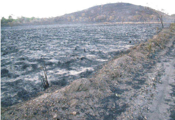
La forbrulita kampo

praktike bruligis 90% de la teritorio de Bona Espero. Kun peno ni, per helpo de la najbaroj nokte kaj de fajrobrigadistoj de Alto Paraíso, sukcesis savi nian legomejon kaj la domojn, sed parto de la tubaro de nia lago kaj la elektraj dratoj de nia instalaĵo bruliĝis kaj ni estas anstataŭigantaj ilin.