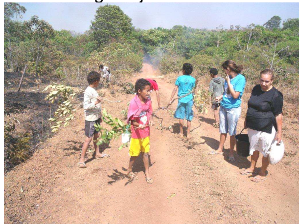
La infanoj helpas estingi la fajron

Ursula informis min (30an de novembro rete), ke oni altransportis al Bona Espero ĝis nun 300 fostoĵoj el cemento por la nova barilo. Ĉiuj fostoĵoj pesas 40 kilogramojn. Nun devas la fortaj viroj meti la fostoĵojn en la teron.