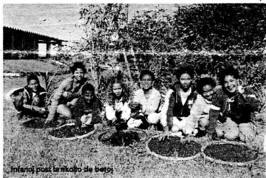
Infanoj post la rikolto de beroj

„Karaj amikoj, finiĝis la pluv-sezono precipe intensa ĉi-jare, sed la naturo estas ankoraŭ brile verda kiel cetere nia espero en eĉ pli bona estonteco.