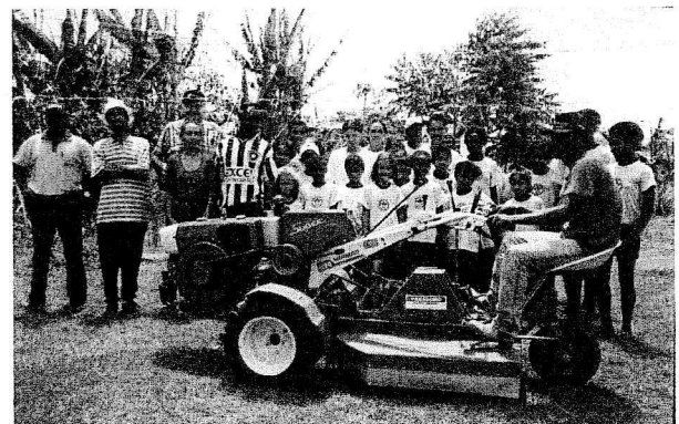
Jen la nova traktoro

En la ĝenerala asembleo estis prezentita la bilanco 2002, kiu post la konvenaj klarigoj de la financa direktoro kaj la deklaro de la kont-revizoroj, estis aprobita unuanime. Aparte oni emfazis, ke la plej granda enspezo, en 2002, estis la subteno de nia Asocio en Germanio, ne nur pro la ĝenerala vivtenado, sed ankaŭ pro la akiro de nia nova traktoro kaj la brila vojaĝo al Fortaleza!