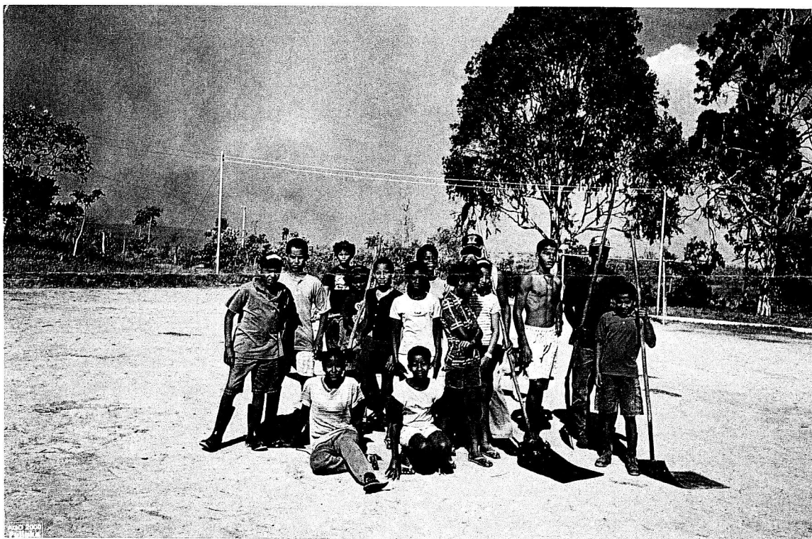
La elŝerpita „fajrobrigado“