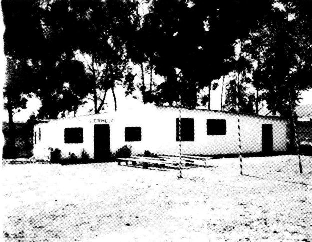
Tio ĉi ne estas bildo de la nova mezgrada lernejo en Alto Paraiso, sed de la elementa lernejo en Bona Espero