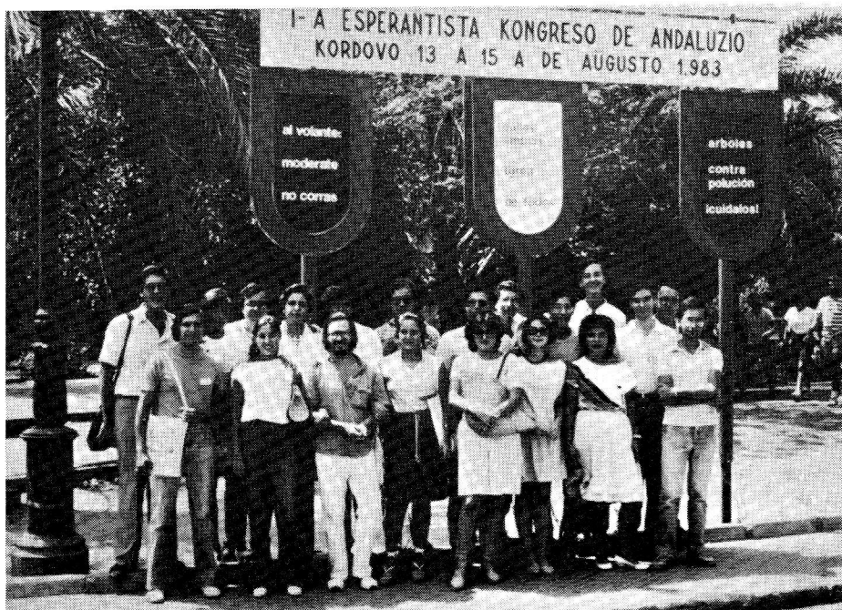
Grupo da gepartoprenantoj.