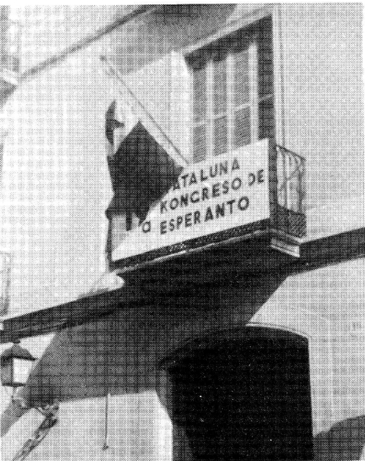
La Esperanto flago flirtas en la Kongresejo.

En Sabadell, de la 29-a de oktobro, ĝis la 1-a de novembro okazis la 19-a Kataluna Kongreso de Esperanto kaj en ĝia kadro, la 23-aj Internaciaj Floraj Ludoj.