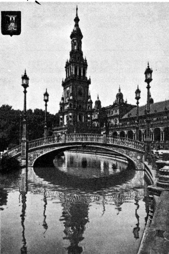
Tipa sevilja angulo

La celo de ĉi tiu artikolo ne estas enuigi vin per listo de belaj monumentoj vizitindaj, per rakonto de tipaĵoj, per la ĉiama diraĵo: la ĉi-jara kongresurbo estas tre bela. Ni volas montri al vi novan, modernan Seviljon, urbon de kongresoj.