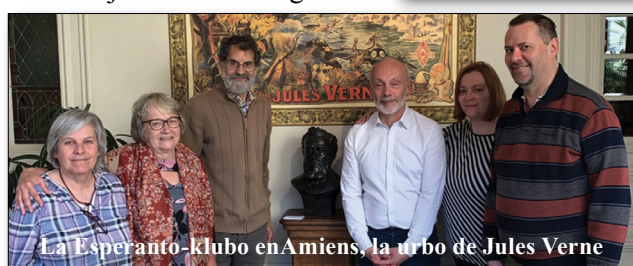
La Esperanto-klubo en Amiens, la urbo de Jules Verne

libron el la franca, kiu nomiĝas „Tagordo“. Li havas multajn projektojn por Esperanto, kaj ĉefe interesiĝas pri enkonduko de Esperanto en la francan edukadsistemon. Li ĵus finis la tradukon de la nova libro de la sama aŭtoro Eric Vuillard. Lia devizo estas: „obstine antaŭen!“.