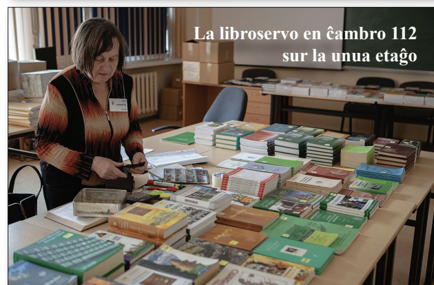
La libroservo en ĉambro 112 sur la unua etaĝo